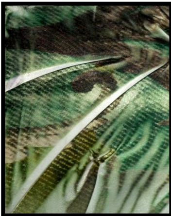
شكل (١) تطبيقات ذاتية للباحثة،تشكيل السطح(قمائن

يتم من خلال إحداث تشكيلات مختلفة بالسطح الطباعي ذاته قبل طباعة التصميم فوقه باستخدام العديد من التقنيات والطرق كالسراجة ، الطي، الكرمشة، التطبيق المنتظم وغير المنتظم ... وغيرها من اساليب التشكيل لعمل عزل جزئي بالسطح لمنع إنتقال الصبغات إلي الأجزاء المطوية نتيجة تلك التقنيات محققة تأثيرات سطحية مميزة، مثال ذلك شكل (١).