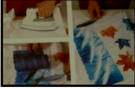
شكل (٢) يوضح تأثير مانع الريش على سطح القماش ، Kate Wells:" Fabric Dying and Printing" – conran octopus limited – octopus publishing Group London Printed in China= 2000. p 110

"يتم هذا التشكيل بالنقل الحراري للتصميم الورقي المراد طباعته