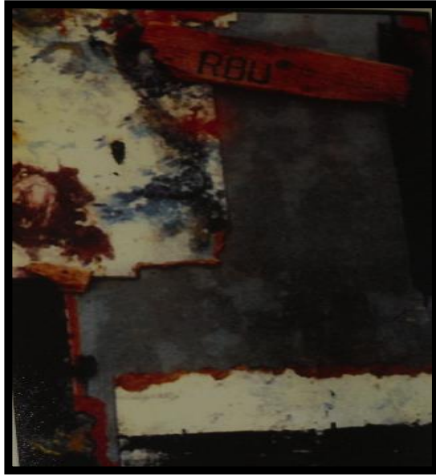
شكل (٦)، منير كنعان، معلقة حائطية ذات مستويات متعددة، ١٩٦٠، www.finart.gov.eg

ثالثاً: شرح وتحليل لبعض أعمال الفنانين اللذين استخدموا خامات مختلفة داخل أعمالهم الفنية بشكل عام والمعلقات الطباعية بكل خاص.