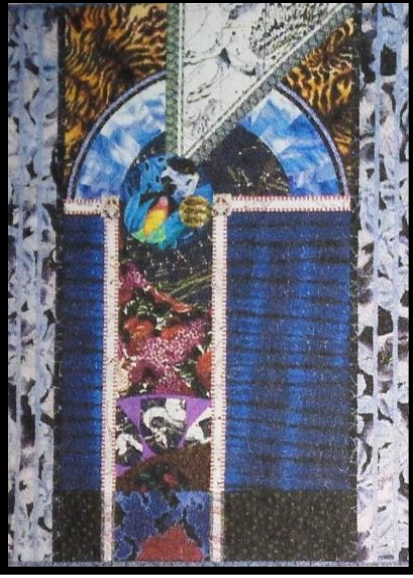
شكل (١٢)،جين ساسمان Jane.a.Sassman، معلقه طباعية منفذة بأسلوبى الطباعة النقل الحرارى والمونوتيب، Ann Batchelder and Nancy Orban:Fiberarts Design Book five,Lark .Books,USA,P227

يشير إليها و يحيطهم مجموعه من الملامس المتعددة.