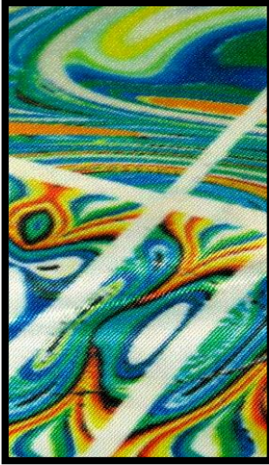
شكل (٣) تطبيقات ذاتية للباحثة، تشكيل الورق الحراري المجهر بالكمبيوتر بالقص ثم طباعة على قماش ستان.