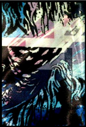
شكل (٤) تطبيقات ذاتية للباحثة، ورق حراري مجهر بالكمبيوتر مطبوع على قماش ستان يوضح الشفافية .

"والمساحات المترابطة هي أن كل وحدة من الوحدات المترابطين يمكن إدراكها كاملاً دون أن تخفي الوحدة التي تقع تحتها ، وفي هذه الحالة يقال ان هناك شفافية قد حدثت بين وحدتين او اكثر، وتشتق