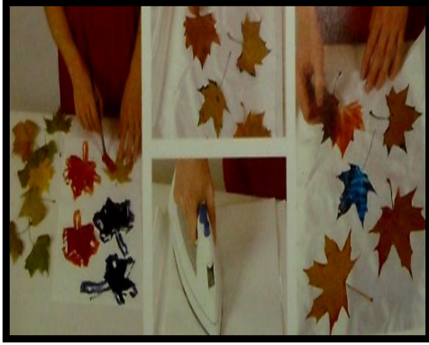
شكل (٥) ، يوضح تأثير الطباعة بالبصمه بأسلوب النقل الحرارى، Kate Wells:" Fabric Dying Printing" – conran octopus limited and octopus publishing Group, London ١٠٩،١٠٨Printed in China– 2000,p

باستخدام ملونات النقل الحرارى يمكن نقل اللون باستخدام الفرشاه أو المدق الطباعى الى البصمات المختلفة مثل (ورق الأشجار، الريش ، المفارش....) و تترك لتجف ثم ترص البصمات على حسب التصميم أو رؤيه الفنان بحيث يكون السطح الملون من البصمة مواجه لسطح القماش