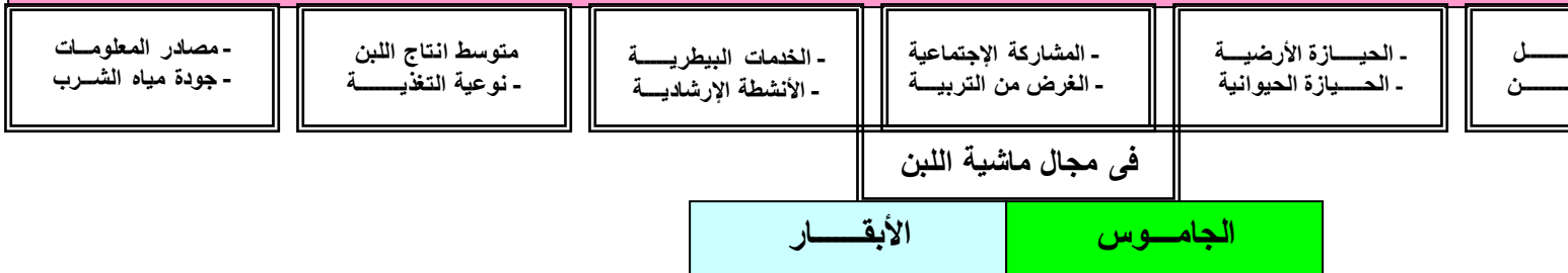
شكل رقم (١) النموذج التصوري المقترح للصحة المالية للمزرعة في مجال ماشية اللبن