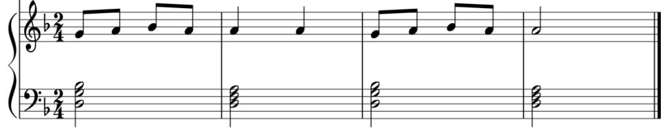
شكل رقم (١)

٢- تقوم الباحثة بالعرف من مازوره (٤:١) وتكرارها ، وذلك ليقوم الطلاب بحفظها .