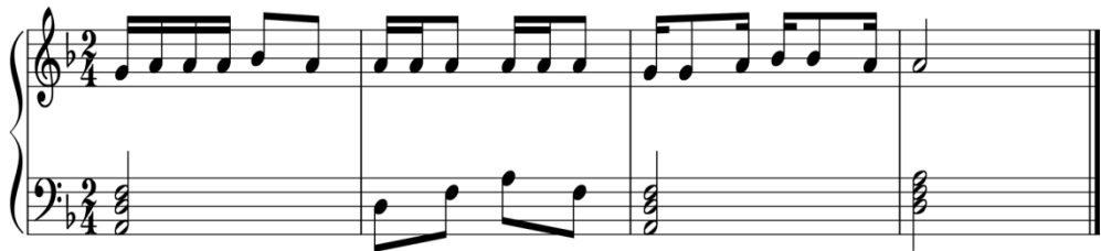
شكل رقم (٥)