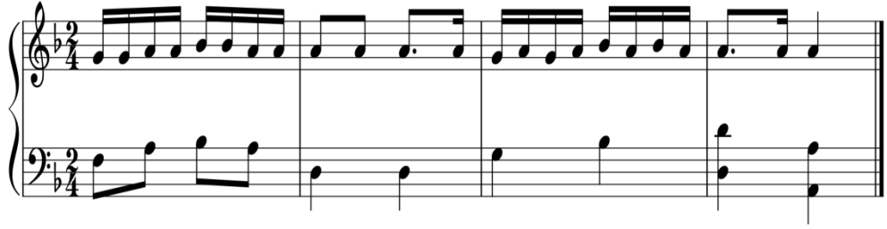
شكل رقم (٦)