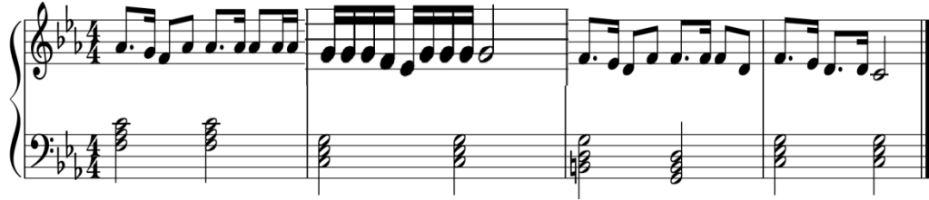
شكل رقم (٨)